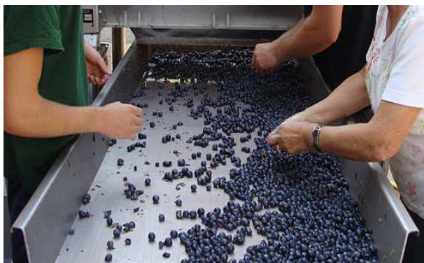
Notre nouveau système de tri permet d'éliminer toutes les impuretés présentes dans la vendange

Si certaines régions viticoles ont enregistré cette année des records de précocité (vendanges réalisées avec 3 semaines d'avance), la situation fut beaucoup plus classique dans le Luberon, avec une récolte achevée à peine une semaine plus tôt que d'habitude. Le printemps chaud et ensoleillé fut suivi d'un été assez frais et pluvieux pour la région mais les pluies sont heureusement intervenues au bon moment, après la floraison et régulièrement pendant l'été, et se sont finalement avérées très bénéfiques.